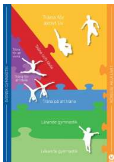
Figur 1. Utvecklingsmodellen enligt Svensk Gymnastik Vill.

Varbergs GIF Gymnastikförening följer Svensk Gymnastiks utvecklingsmodell och nyckelfaktorer enligt dokumentet "Svensk Gymnastik Vill" (se nedan).